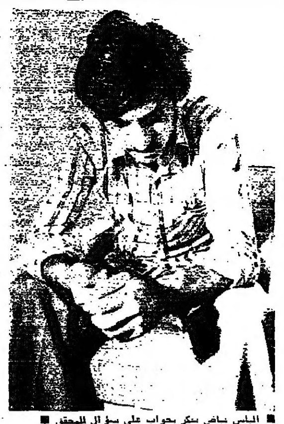
البياس صاخر بجواب على سؤال المحقق: البياس تفتيش على باب مقر المفزة